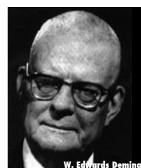
W. Edwards Deming